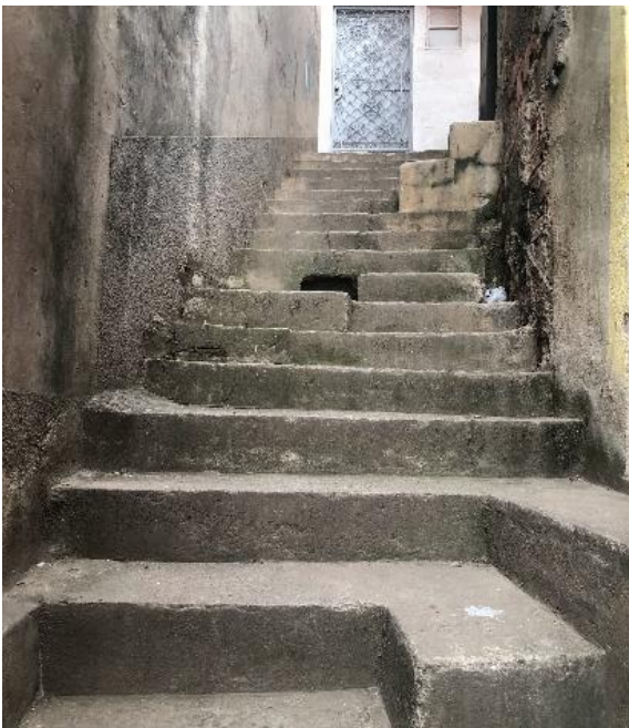
Figuras 8 e 9. Escadas de acesso à região do Morrinho - Morro da Providência.