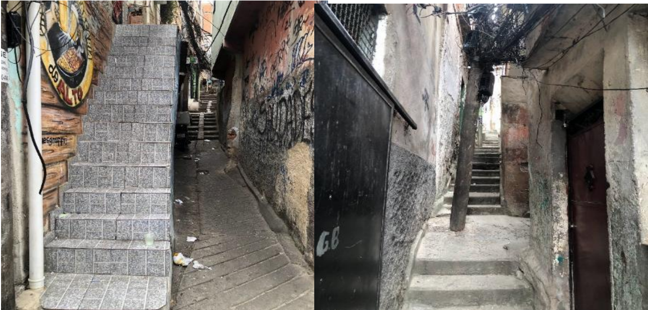
Figuras 2 e 3. Travessa Iza – Jacarezinho.

com o percurso histórico do território e com os múltiplos modos de habitar e atribuir sentido ao lugar.