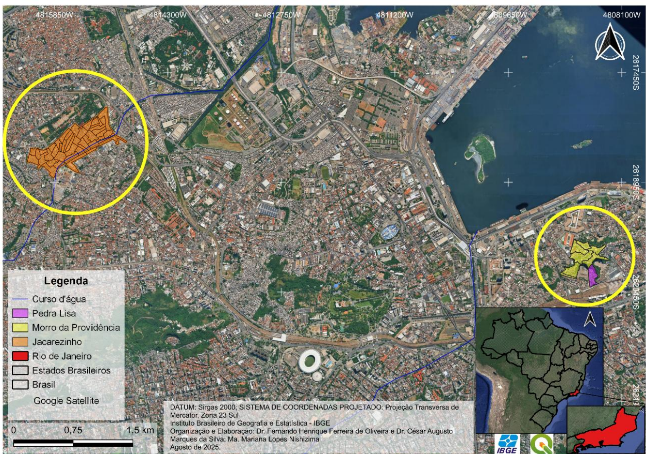
Figura 1. Mapa de localização da área de estudo: favelas do Complexo do Jacarezinho e do Morro da Providência.

Essa experiência de campo demandou tempo, paciência e a construção gradual de vínculos, ressaltando a importância da escuta atenta e do respeito às trajetórias dos sujeitos (Haraway, 1995). Em suma, a pesquisa buscou articular rigor metodológico com uma postura ética sensível às dinâmicas sociais e afetivas dos territórios estudados.