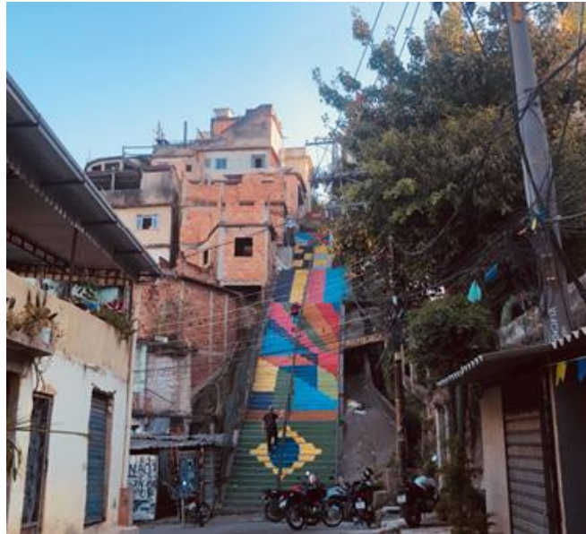
Figura 7. Escadaria do Cruzeiro – Morro da Providência.