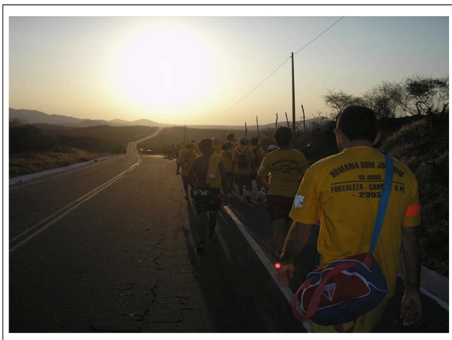
Figura 2. Romeiros no caminho à Canindé

“sei que é difícil, estou sentindo muitas dores nas pernas, tenho até problemas de coluna, mas este sacrifício vale a pena. Essa é a segunda vez que venho em romaria, até pensei em desistir, mas quando chega o dia de partir, então venho, compro minha camisa e vou com a turma (...) as dores a gente aguenta assim mesmo, pois tem que ter o sacrifício, mas sei que a fé em São Francisco é maior e eu chegarei à Canindé”.