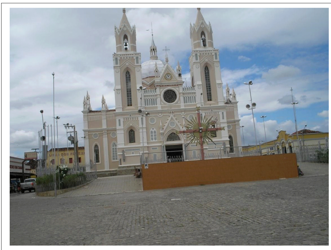
Figura 1: Basílica de São Francisco das Chagas na cidade de Canindé-CE