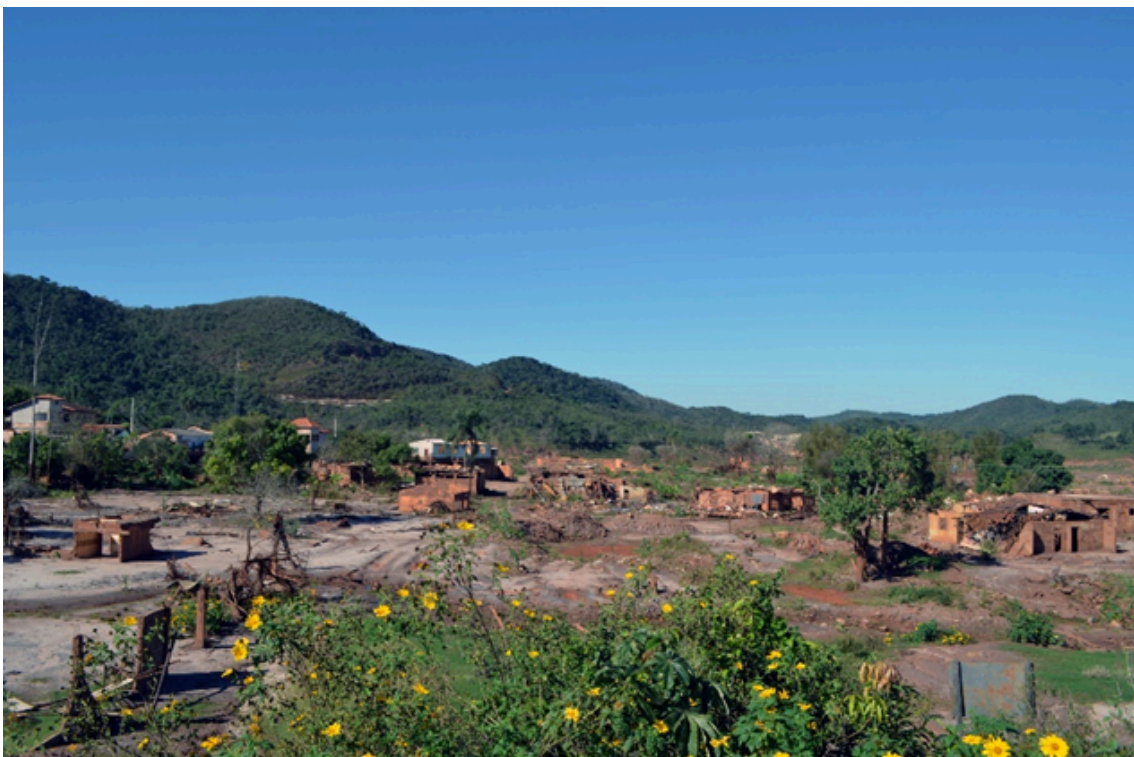
Figura 1. Vista panorâmica de Bento Rodrigues em visita no dia 18/06/2016.

Após passar o dique, seguiram na estrada que, em parte, coincidia com o que um dia fora o leito do Rio Gualaxo do Norte e suas margens. Subiram e chegaram a uma parte mais alta, de onde puderam visualizar toda Bento Rodrigues, um grande deserto vermelho com as ruínas das casas de uma, àquele momento, cidade fantasma.