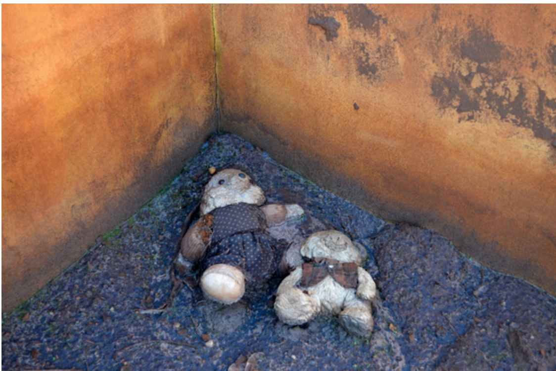
Figura 2. Vestígios do cotidiano numa das casas atingidas em visita no dia 18/06/2016

A paisagem como conjunto único e indissociável era a expressão da prática histórica daquele grupo sócio-espacial, revelada para além das questões materiais, abrangendo as condutas e relações sociais que estabeleciam. (Castoriadis, 1982, p.33).