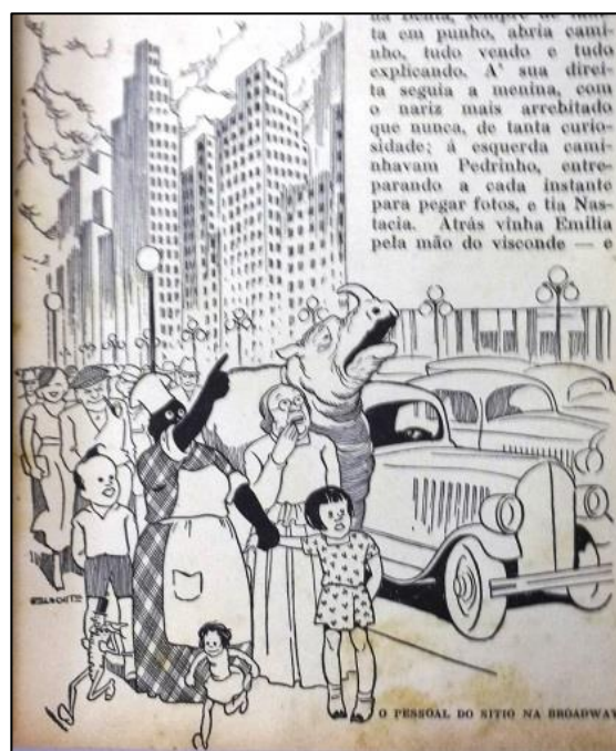
Figura 3 - “O pessoal do sítio na Broadway”. A figura que ilustra a passagem das personagens pelos Estados Unidos não se exime da expressão do pensamento do autor correspondente na palavra escrita: para além de contemplar Nova York, ao leitor, vê-la poderia soar como desejá-la. Embora

Jacinto (2015) os estudos literários em comunicação com o conhecimento geográfico associam-se pela ação do viajar, que atribui caráter de itinerância às narrativas: “[...] o cerne e elemento de ligação entre Literatura e Geografia é a viagem, que funciona para o escritor como o trabalho de campo para o geógrafo.” (JACINTO, 2015, p. 9). Pelo aspecto da viagem, vão se estabelecendo geograficidades que vão atribuindo ao leitor um senso de pertencimento e de posse dos locais que se vão visitando, como um modo de apropriação do bem-comum que é a pátria e que lhe possa despertar um sentimento de cuidado e de dever.