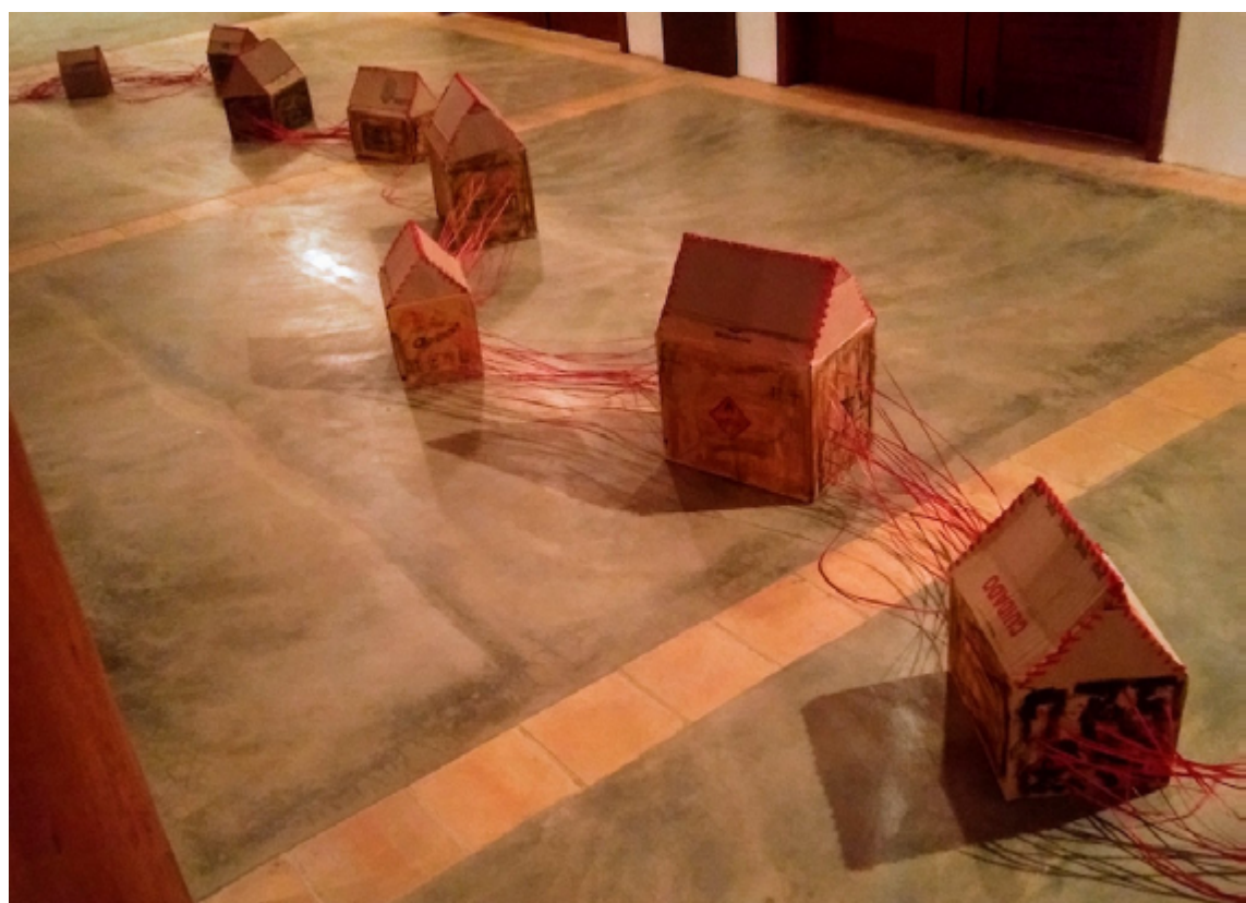
Figura 2 Maxim Malhado, -C-A- -S-A-, 2020. Papelão, palha tingida e linha de tricô vermelha, dimen- sões variadas.