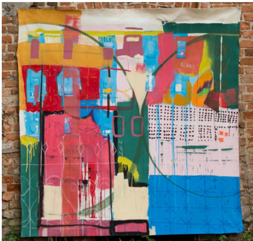
Figura 1 Agrade Camíz, Sinta-se em casa mas lembre-se que não está, 2020. Látex, acrílica, pastel oleoso, pastel seco e spray sobre lona de algodão, 200 x 210 cm.

Outro artista que nos provoca a pensar as estruturas de casa presentes no país é o artista baiano Maxim Malhado. Desde os anos 1990, a casa é o ponto de partida para os trabalhos de Malhado, que incluem esculturas que reproduzem principalmente construções de pau a pique, miniaturas de vilas, além de móveis e objetos de madeira. Na exposição virtual, ele apresentou o trabalho -C-A-S-A-, esculturas de papelão produzidas em abril de 2020. Nesse trabalho, sua trajetória artística usualmente dedicada a representar