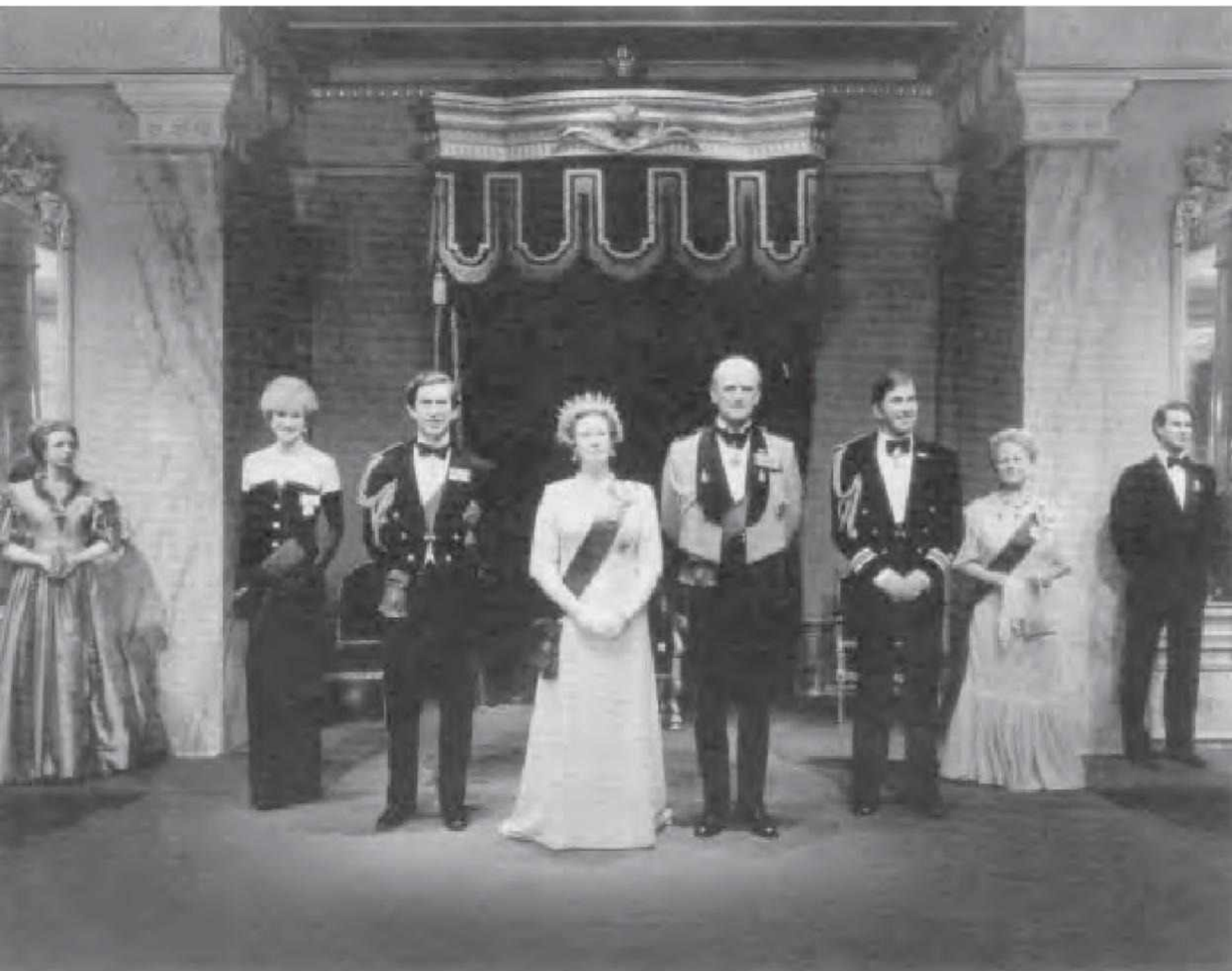
Hiroshi Sugimoto (japonês, residente nos EUA, nascido em 1948), The Royal Family, da série "Wax Museums".