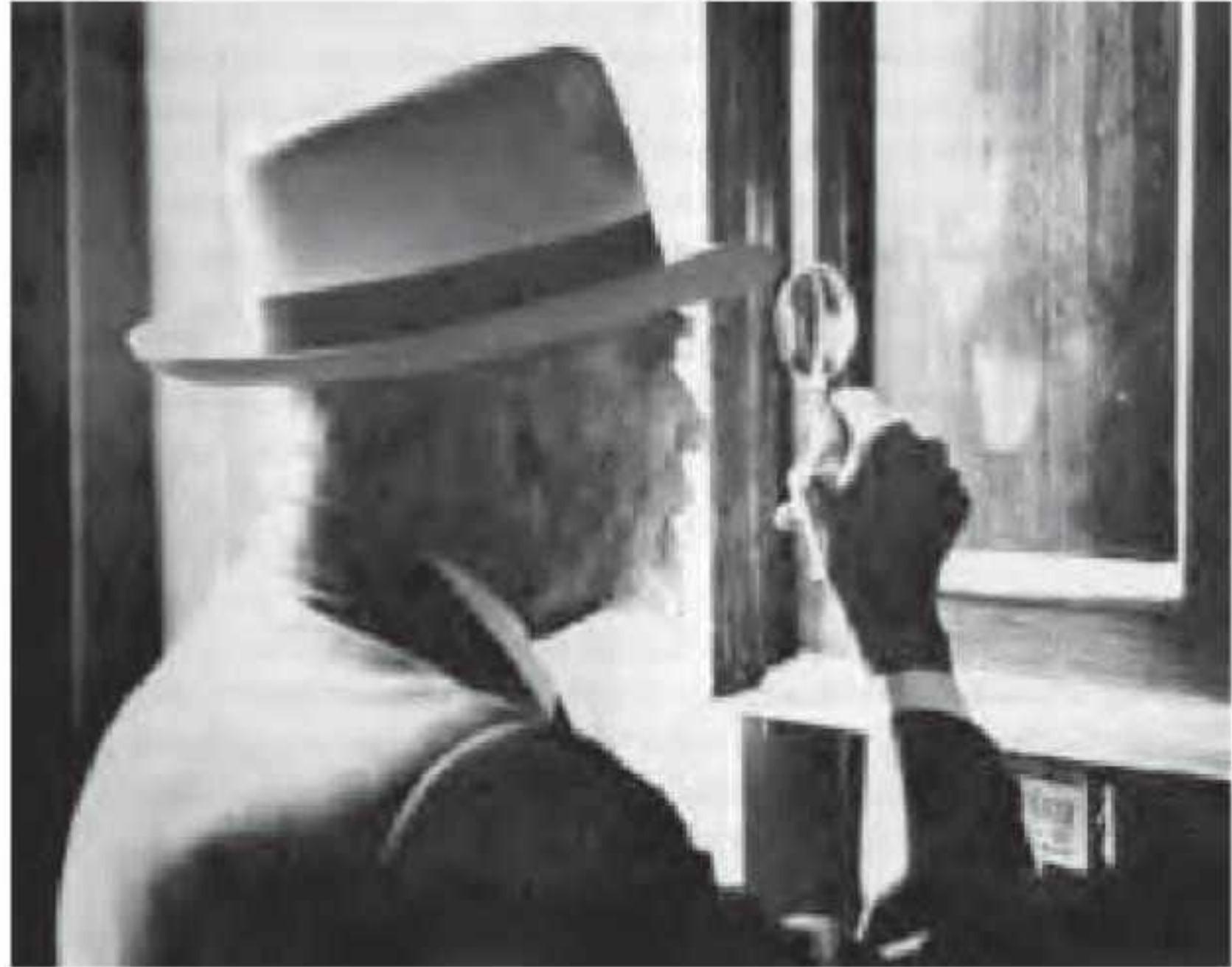
Bernard Berenson na Villa Borghese, Roma, 1955

o vestígio de um crime ocorrido no local e que poderia ter passado despercebido; inspeciona tanto quanto Berenson procura o vestígio da arte de Dürer. Nós, entretanto, costumamos fazer o oposto, e tendemos a ignorar o medium enquanto olhamos para uma imagem, como se as imagens pudessem existir por si mesmas. Imagem e medium , tão inseparáveis no resultado, novamente separam-se em nosso olhar. Artistas contemporâneos, como Andy Sherman, usam essa ambivalência para criar confusas referências cruzadas entre diferentes media (efetivamente tão usados quanto aqueles mencionados), chegando ao ponto em que não podemos mais seguramente discriminar imagem e medium . Menciono apenas seus pseudoquadros de filmes, que simulam filmes, mas são meras fotografias, ou penso em suas máscaras, as quais ela realiza utilizando a si mesma como modelo dessas fotografias, da mesma maneira que os modelos em antigas pinturas. 34