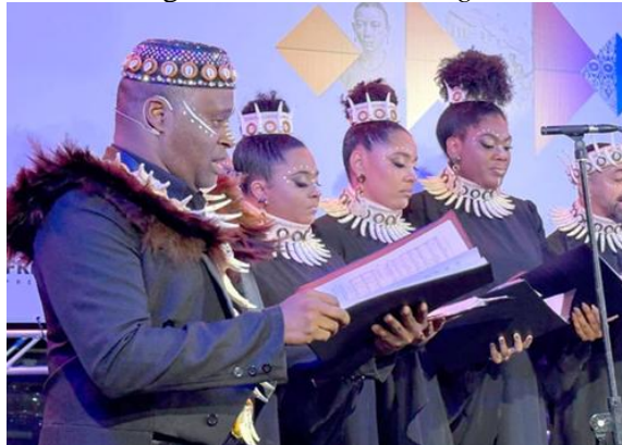
Figura 1– Coral Ouro Negro