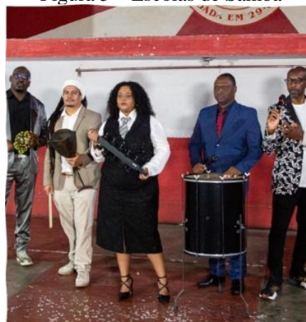
Figura 5 – Escolas de Samba