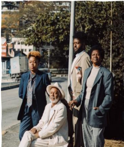
Figura 2 – Excelência preta