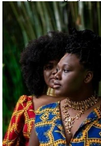
Figura 3- Agodjié