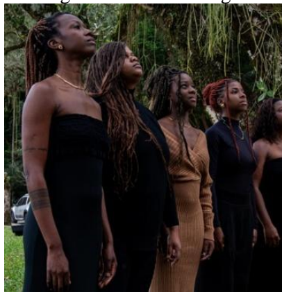
Figura 6 – Estética negra