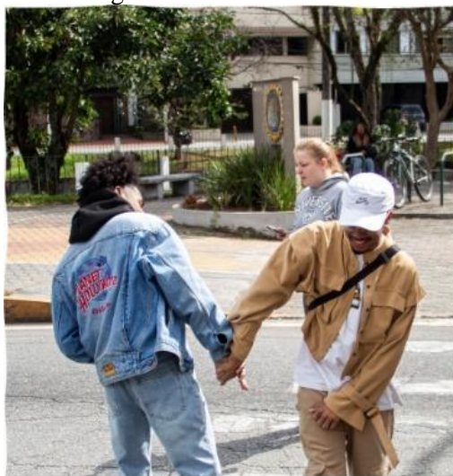
Figura 7 – Afro-Urbanismo