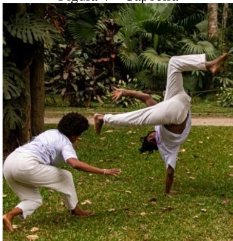
Figura 4 – Capoeira