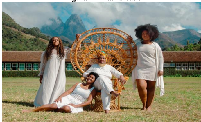
Figura 1– Matriarcado