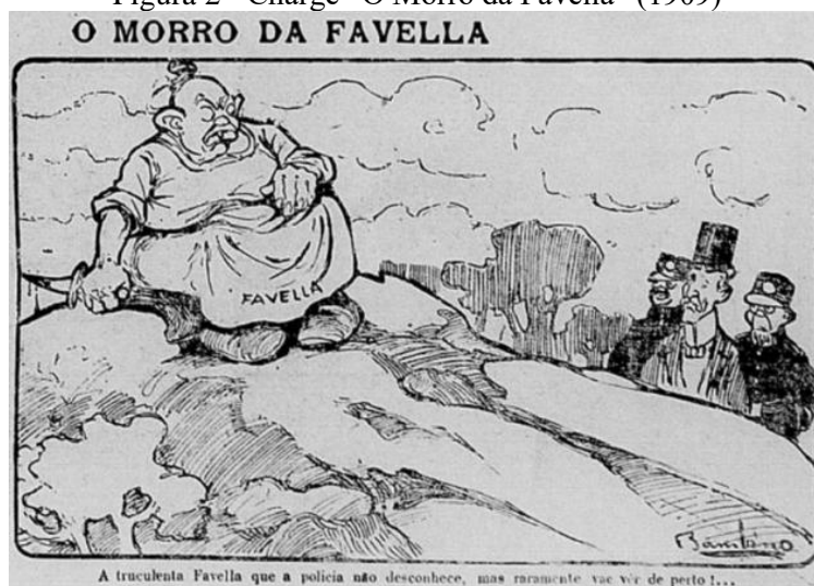
Figura 2 - Charge “O Morro da Favela” (1909)