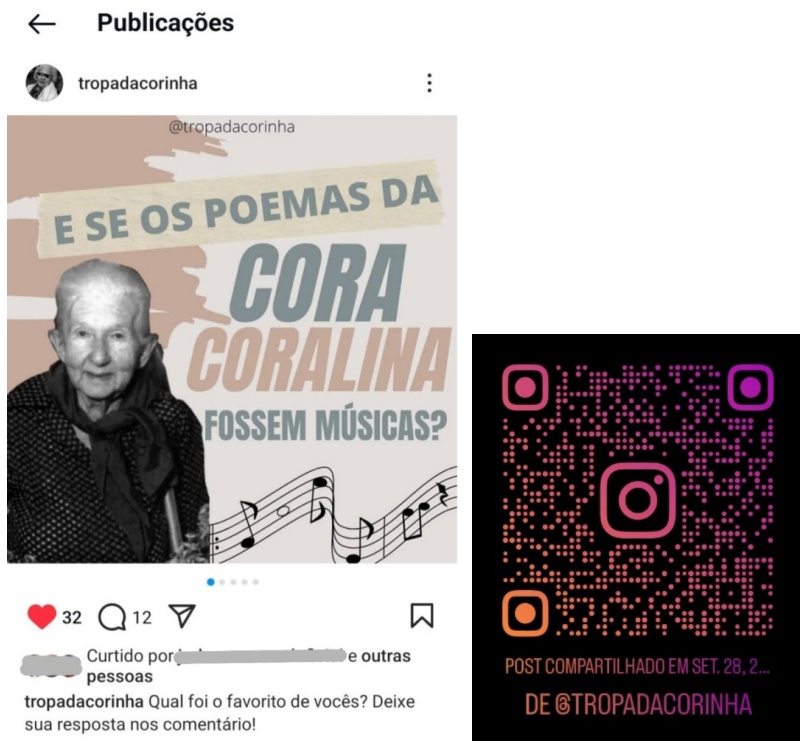
Figura 5 — Post “E se os poemas da Cora Coralina fossem músicas?” 6