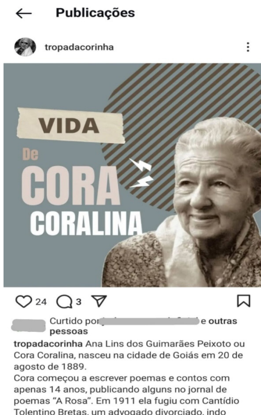
Figura 3 — Postagem elaborada pelo GT1

As anotações, enquanto gênero discursivo (Bakhtin, 2003; Santos, 2016), reforçam o caráter dialógico da produção de texto (Bakhtin; Volochínov, 2009), uma vez que, no processo colaborativo de planejamento do texto multimodal, a comunicação verbal também leva o aprendiz a conhecer e a refletir sobre práticas de comunicação de seu mundo, sobre o outro e sobre si, no contexto da interação nas redes sociais, como é demonstrado no excerto [03] e representado graficamente na figura 2. A figura 3 demonstra o resultado do diálogo citado no excerto [03] e tecido de anotações na figura 2.