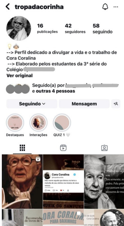
Figura 1 — Perfil @tropadacorinha