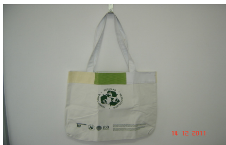
FIGURA 1: sacola ecológica confeccionada pelas sentenciadas.

As próprias sentenciadas que trabalham na confecção das sacolas asseguram que ainda não sabem se vão ou não receber pela produção das mesmas, pois esta informação não fora passada a elas de forma oficial e o que sabiam eram apenas avisos informais. Até a elaboração deste artigo, elas ainda não haviam recebido pelo trabalho, que já acontece há onze meses. Vale lembrar que estas sacolas são sorteadas e distribuídas em vários pontos da cidade, sem qualquer tipo de informação referente ao fato de serem realizadas com mão-de-obra gratuita.